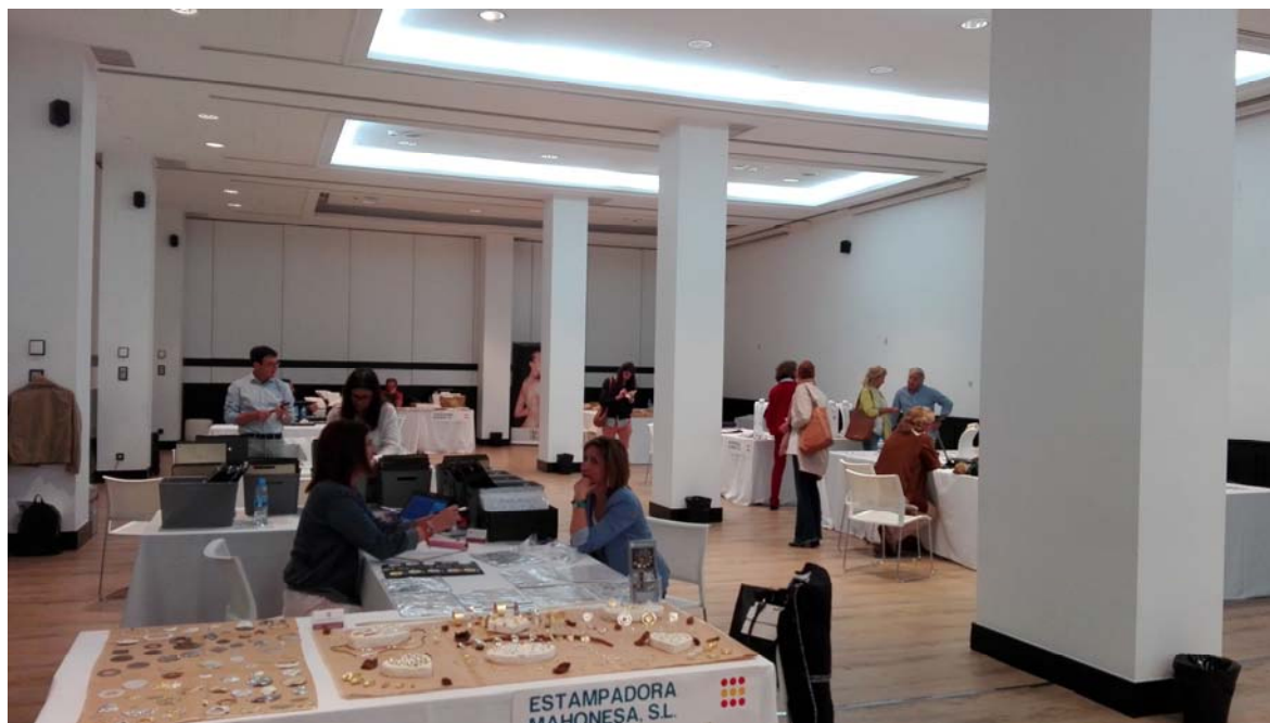
Salones Hotel Ilunion Suites Madrid

No quedarán incluidos los gastos de desplazamiento en avión, y estancia, así como el transporte de mercancía hasta Madrid y regreso, de los que deberá hacerse cargo cada empresa.