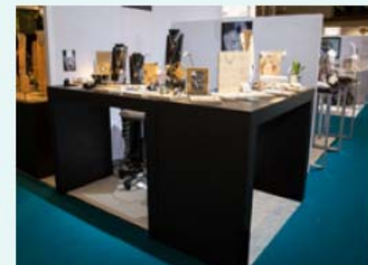
Ex. : 4sqm Pack / 1 corner