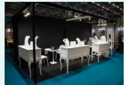
Ex. : Turnkey Pack Classic 12sqm / 2 corners