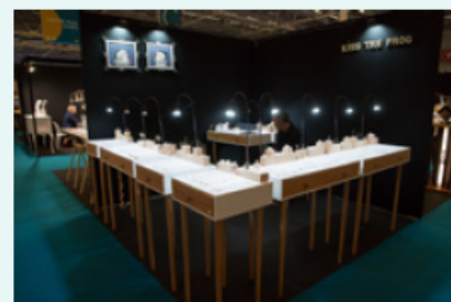
Ex. Standard Pack 9 sqm / 1 corner

Attention: Lighting and furniture are not included in the pack