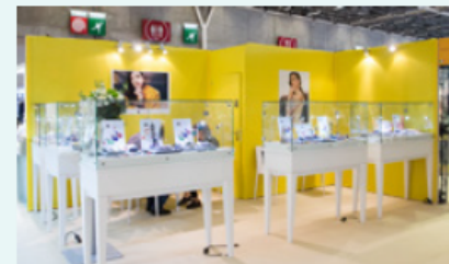
Ex.: Turnkey Pack First 15sqm / 2 corners