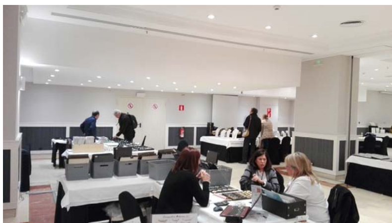
HOTEL TRYP APOLO (Salas Llobregat+Segre+Ter)

No quedarán incluidos los gastos de desplazamiento en avión, y estancia, así como el transporte de mercancía hasta Barcelona y regreso, de los que deberá hacerse cargo cada empresa.