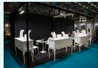
Ex. : Turnkey Pack Classic 12sqm / 2 corners