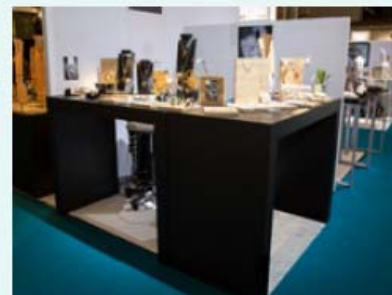
Ex. : 4sqm Pack / 1 corner