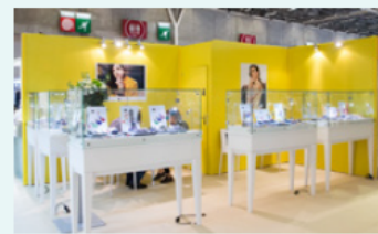
Ex.: Turnkey Pack First 15sqm / 2 corners